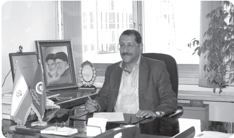
مدیر کل امور مالی سازمان مرکزی تعاون روستایی ایران: