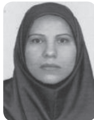
تهیه و تدوین: آذر رحیم پور محل خدمت: مدیریت اموراداری

در نهایت می توان اشاره کرد، دو مورد قابل توجه است اول اینکه بیشترین نشانه ها به سمت مدیران می باشد و دوم اینکه محور اصلی منابع انسانی و مدیریت بر پایه این سرمایه انسانی است. به عبارتی مدیران وقتی می توانند به موفقیت دست یابند که ابتدا به نیروی انسانی خود توجه کنند بعد به کار.